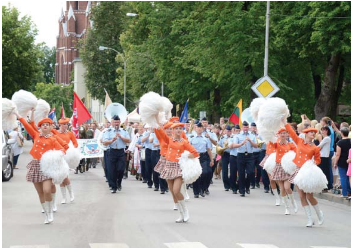
Švęsti Anykščių rajonui daug priešasčių nėra - pernai rajonas ir toliau sparčiai traukėsi – mirė 533 žmonės, arba tris kartus daugiau gyventojų nei gimė. Pernai Anykščių rajone įregistruotas 151 kūdikis.