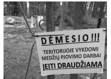
Dėl medžių pjovimo darbų drausta lankyti kapines.