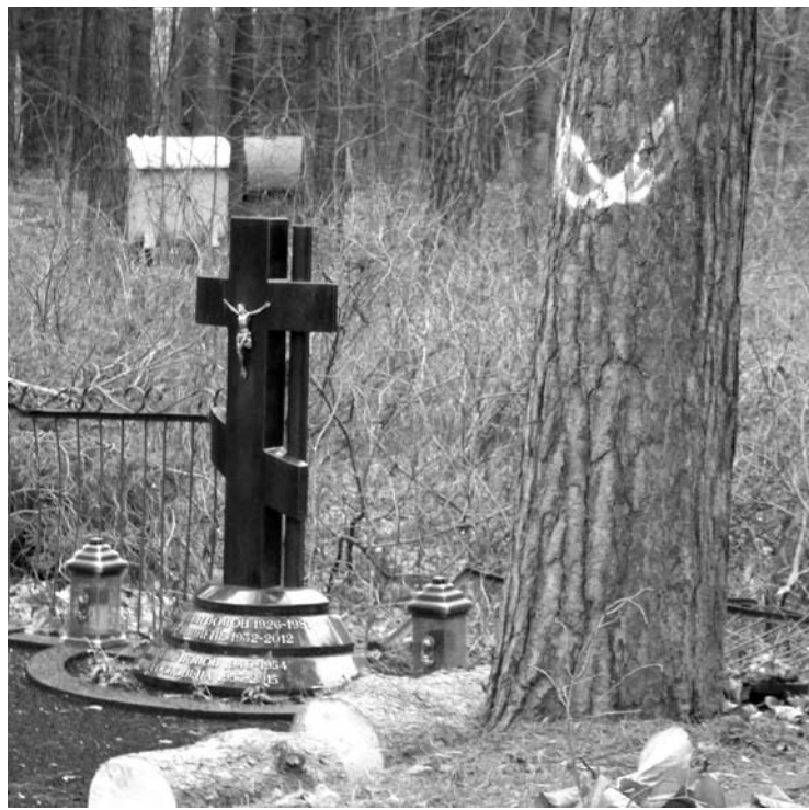
Kapinėse medkirčių laukusios pušys buvo paženklintos.