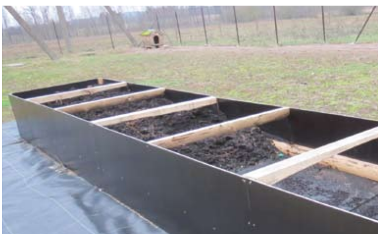
Į specialias dėžes sodinukai bus sodinami atviromis šaknimis.