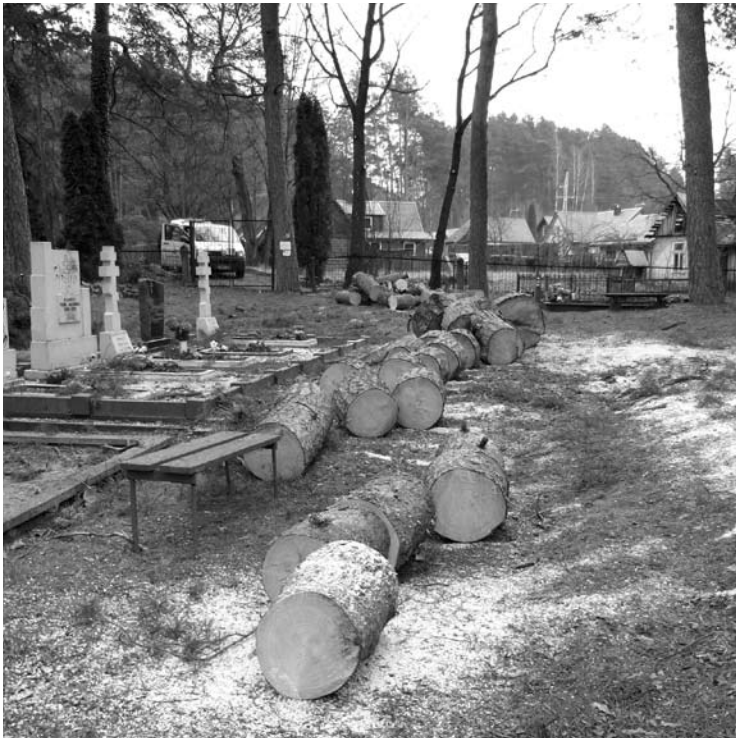
Anykščių miesto rusų kapinėse buvo nupjautos trys pušys.

Į „Anykštos“ redakciją trečiadienį skambinęs vyras piktinosi, kad Anykščių miesto rusų kapinėse pjaunami medžiai. Anykštėnas tikino, kad pjaunami sveiki medžiai, jog valdininkai užsakydami medžių pjovimą elgiasi, kaip barbarai.